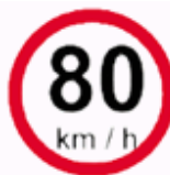
Velocidade Máxima Permitida