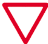
Dê a Preferência