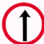
Siga em Frente